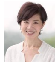
コファシリテーター