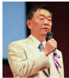
〔竹田寛氏〕 三重大学医学部画像診療科教授 NPO 法人がんリボンズ理事