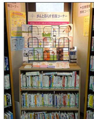
川崎市立麻生図書館 (健康情報コーナー) * 書架上、中央の卓上型ラックが 「がんと暮らす情報コーナー」ラック