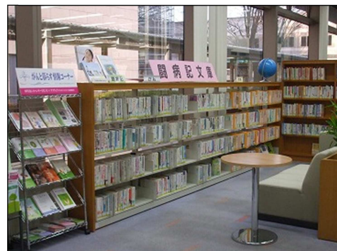
鳥取県立図書館(医療・健康情報コーナー) * 左手前が「がんと暮らす情報コーナー」ラック

なお、ラックに設置した冊子は、がん検診や予防に関するもの、病気への理解を深めるもの、術後のこと、リワーク(がん患者さんの就労継続)・食事・運動・美容など毎日の生活に関わるものを中心にキャンサーリボンズがコーディネートし、患者さんだけでなく多くの方に有用と思われるものを選んで、各企業(アストラゼネカ(株)、アフラック、ノバルティスファーマ(株)、バイエル薬品(株)、ヤンセンファーマ(株)、ロート製薬(株))からご寄付という形で提供していただきました。