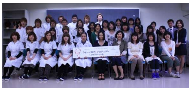
カット後の記念撮影 みなさんおつかれさまでした。

さあ、カット開始です。まずは、どれぐらいの長さにするか相談です。どんな髪型にしたいかをじっくり話ができたら、髪をゴムでくくり、その上でカットします。平均20cmでしたが、中には30cm近く寄付してくださった方もいました。