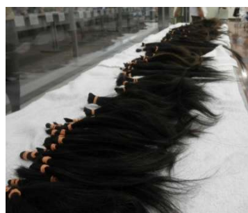
たくさんの髪の毛をご寄付いただきました。

看護学生さん、昨年約半年間パンテーンで丁寧にケアしながら伸ばしていただきまして、ありがとうございました。おかげさまで、素敵なウィッグができそうです！