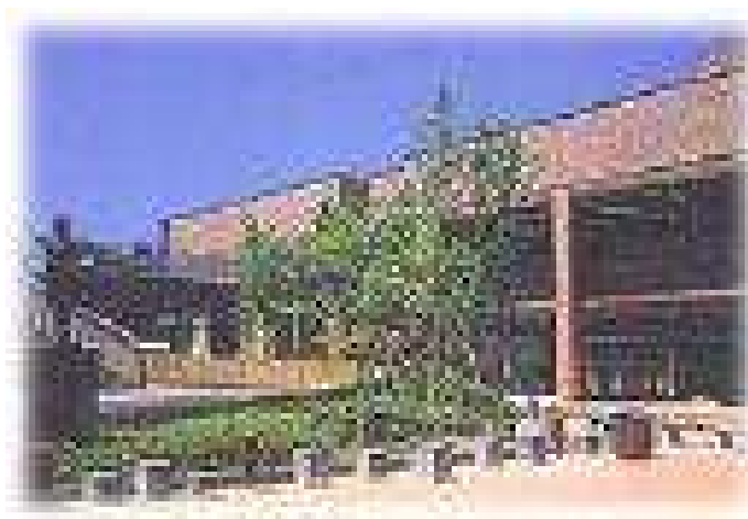
川崎市立麻生文化センター