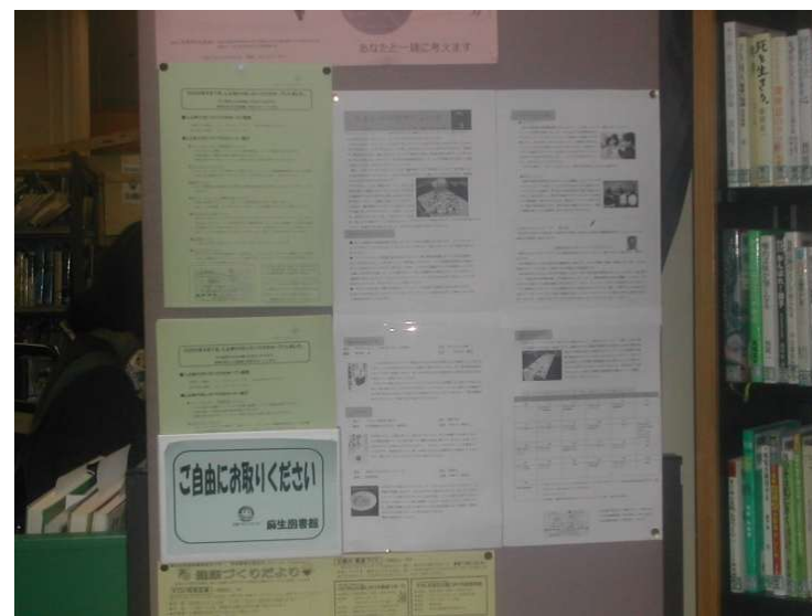
麻生図書館内に設置された、しんゆりリボンスハウスコーナー