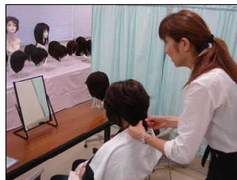
ウィッグ試着の様子

看護学生からの髪の寄付、P & Gパンテーンの収益の一部からの寄付も活用し、その他多くの皆さまに支えていただきながら活動を続けていますが、一人でも多くの女性に医療用ウィッグをお届けするために、継続的にご支援くださる「キレイの力」サポーターを募ることにいたしました。年1回(一口5,000円)定期的にご寄付いただくもの