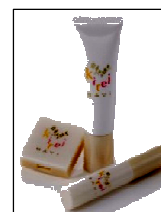
「kirei NAVI キレイナビ」