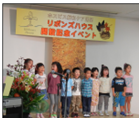
院内保育園児の合唱の様子