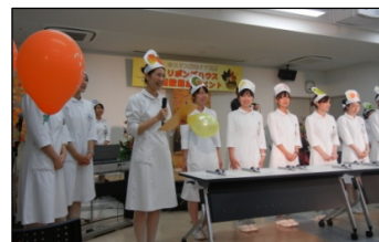
看護師による出し物

京都医療センターリボンズハウスは、専任スタッフが常駐、また、病院に関わる全ての人(院長はじめ、医師、看護師、事務方、医療者のご家族など)が、リボンズハウスの運営に関与します。