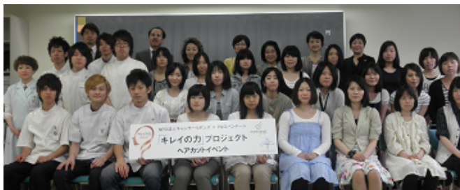
ヘア・カット後の、看護学生さんと理美容専門学校学生さんの様子

3年目となる『キレイの力』プロジェクト。プロジェクトに参加した看護学生の髪をカットして寄付していただく「ヘアカット・イベント」を、6月12日(日)に窪田理容美容専門学校(東京都中野区)にて行いました。