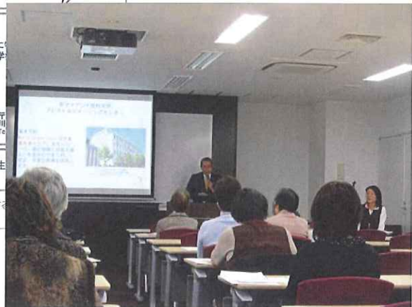
▲福田先生の講演の様子