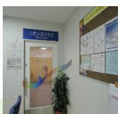
2名のスタッフが常駐