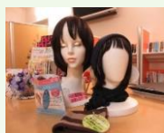
頭皮ケア・ウィッグ相談 月9回 8メーカー