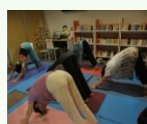
リラックスヨガ 月1回