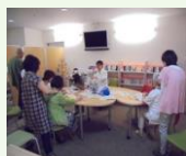
タッピングタッチ 月1回