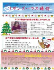
リボンスハウス 通信の発行