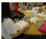
アロマ教室&勉強会 月2回